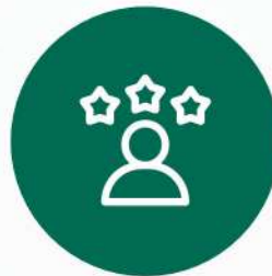
REPUTACIÓN Y MARCA