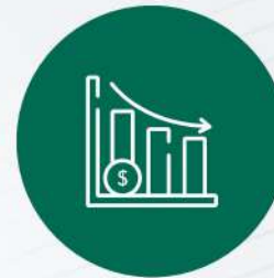
CAMBIOS EN EL MERCADO