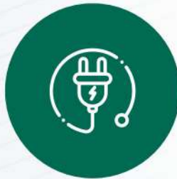
COSTO DE ENERGÍA