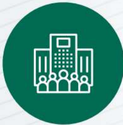
PROYECTOS DE GRANDES DIMENSIONES