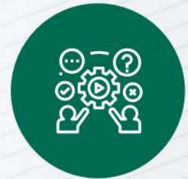
FRAUDE Y ÉTICA

El riesgo reputacional presenta las siguientes características: