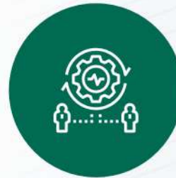
CONTINUIDAD DEL NEGOCIO